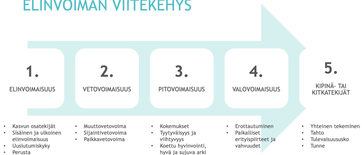
Kuvio 1. Kukoistavan alueen viitekehys